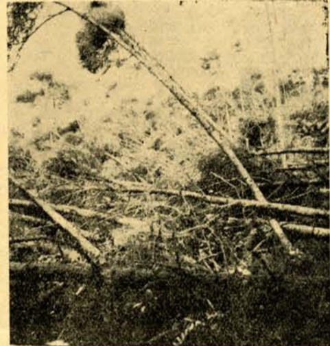
寫眞 (上左) 全壊した市内の家屋 (上右) 大きな穴のあいた学校の屋根 (下右) なぎ倒された樹木 (下左) 糸井の水田を視察している市議会議員