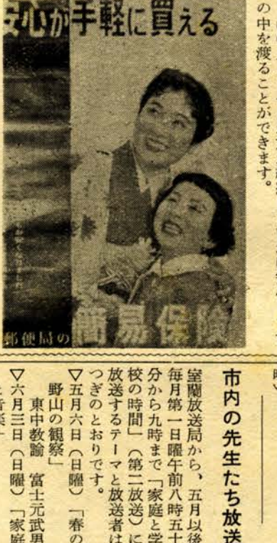
切が手軽に買える

四月簡易保険特別増強運動 見えない力 橋をささえている堅ろうな支柱は、これがあるから電車も自動車も安心して渡れます。簡易保険は人生の支柱です。目には見えませんが加入継続していれば安心して世の中を渡ることが出来ます。