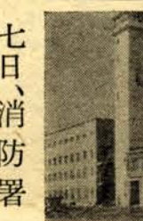
写真：完成した消防署舎

旭町市役所庁舎裏手に建設中の消防本部、消防署庁舎の落成式は七日午前九時から新築庁舎で行います。旭町市役所庁舎裏手に建設中の消防本部、消防署庁舎の落成式は七日午前九時から新築庁舎で行います。旭町市役所庁舎裏手に建設中の消防本部、消防署庁舎の落成式は七日午前九時から新築庁舎で行います。