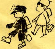
四月の広報ごよみ

★1日—安全都市宣言市民式(市立総合病院) 大会(市役所前広場)昭和37年度ごみ処理手数料実態調査(5月31日まで) ★3日—自動車運転免許試験(6日まで、自動車学校) ★5日—第四回北海道道央・道南都市監査委員会会議(6日まで、ウトナイト) 四月巡回文庫(5日まで、各ステーション)第五回入学式(自動車学校) ★7日—啓北中開校式(啓北中学校)光洋中開校式(啓北中学校) ★9日—高等看護学院入学式(市役所前広場) 産税・都市計画税第一期分(市役所前広場) ★16日—昭和37年度固定資産評価(市役所前広場) ★29日—天皇誕生日 納期(30日まで) ☆17日—補導センター事務局長会(公民館) ☆20日—第四回卒業式(自動車学校)原動機付自転車運転免許試験(自動車学校)春期火災予防運動(29日まで) ☆21日—少年消防クラブ始業式(消防本部) ☆22日—図書館協議会(公民館) ☆24日—補導委員会(公民館) ☆26日—青少年問題協議会(市役所前広場) ☆29日—天皇誕生日