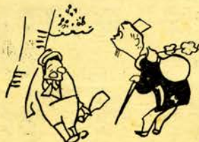
五月の広報ごよみ