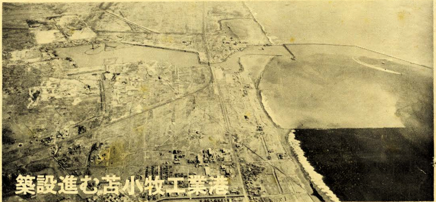
建設進む苫小牧工業港

市広報紙は毎月1、11、21日の3回各連絡員に直接お届けしております。(ただし、一部の連絡員には郵送)もし未配や遅配などお気付きのことがありましたら広報係へお知らせ願います