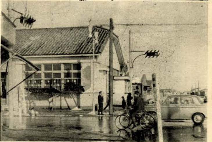
(写真上) 樽前山神社の交通安全祈願祭、下は駅前通りと三条通りの交差点に新設されたシグナル