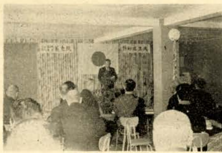
(写真は養老院の落成式)

山手町市立養老院「静和荘」は、昨年末第二期増築工事も終えましたので、十八日午前十一時から同養老院で落成式を盛大に行ないました。席上、工事請負者鈴木建設、大信工機、管野電気の代表三人と、王子製紙はじめ、養老院に二万円以上寄付したつぎの二十一氏、またテレビ、洗濯機を寄贈したライオンスクラフに市長からそれぞれ感謝状をおくりました。引続き、創業五十周年記念に五百万円を市に寄付して養老院建