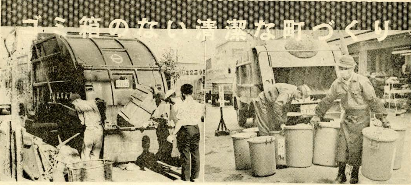
現在はゴミ箱からゴミを集めておりますが…