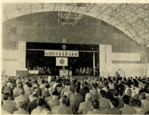
立谷さんら受彰 札幌管内更生保護大会で 犯罪対策の一つとして更生保護制度の重要性がますます加わりつつある この大会には来賓札幌検察所長、札幌地検検事正、札幌刑務所長らのほか、札幌管内の二十一個保護区(十五市七町)から保護司約八百人が参加しました。

今年度の腸パラ予防接種一回目は、本紙前号でお知らせしたとおり十日から十五日まで市街、部落各所で行なわれますが、二回目、三回目は日程はつきのとおりですから、該当者はもよりの会場でお忘れなく受けてください。(カッコ内は三回目) ▽17日(24日) 後1半 2-1わかかば保育所、同2-3 1-区会館同1半 3-中野会館、同1-西町会館、前11 正午 沼の端診療所後1半 2-沼の端小、同2半 3-静川小 ▽18日(25日) 後1半 3-1二区会館、同上 1-八区会館、同上 1-植苗小、同2半 3-柏原小 ▽19日(26日) 後1半 3-1緑町二区会館、同上 1-八区会館、同1半 2-1ひまわり保育所、同2 3-1公民館、同1半 2-1糸井菅原官一氏宅、同2 2半 糸井佐 ▽20日(27日) 後1半 2-1すみれ保育所、同2 3-1七区会館同1半 3-1緑町三区会館、同上 1-市役所、前11 正午 錦岡診療所 後1半 2-1錦岡小、同2半 3-1樽前小 ▽21日(28日) 後1半 2-1あさひ保育所、後2 3-1旭地区連合会館、同1半 2-1日通会館同1半 3-1山手集会所、同1 2-1勇払消防会館、同2 3-1勇払国策病院 ▽22日(29日) 後1半 3-1岩倉組、同上 1-勇払国策(三回目なし)、同2 2半 1-丸山小 ▽三千元 浜町40 鈴木昭二郎さん(祖父の全快祝い)を慶して養老院「静和荘」へ八日 助産婦、飛鋪病院高橋栄養士、市保健婦 ▽27・28日 緑町二区会館(緑町木場町地区) 講師 田辺医院医師 矢嶋助産婦、飛鋪病院高橋栄養士 市保健婦