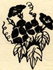
七月の広報ごよみ

最近港が動きだした市の経済にどの様な影響があるだろうか。すなわち経済効果の現われ方、市経済の動向に関心をもちたいところである。最近港が動きだした市の経済にどの様な影響があるだろうか。すなわち経済効果の現われ方、市経済の動向に関心をもちたいところである。