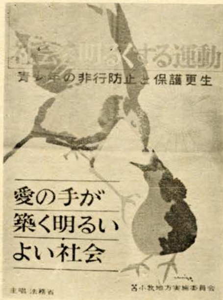
主催 法務省 苫小牧地方実施委員会

放送 ▽その他一愛のはがき寄贈運動（寄贈を受けた郵便ハガキを施設収容者に配付し、家族との音信を強めるようにする）②協力者へ更生保護誌の配付