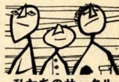
私たちのサークル

最近苦小牧地方も、音楽愛好熱が高まり、種々の愛好会、催し物が多く開催されているようです。苦小牧も札幌と並び多くの放送局にリクエスタをしていくリクエスタの名前が聞かれるようになりました。そこで数人のリクエスタが集まってできたのが苦小牧ポピュラー友の会です。友の会が公民館のサークルにはいつたのが七月ですからサークルの中では一番新しい卵で、それだけに、こんな期待もてるサークルの一つと思っております。私たちポピュラー会