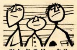
私たちのサークル