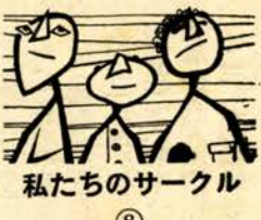
私たちのサークル