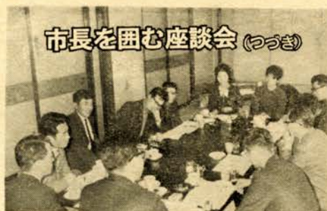
市長を囲む座談会 (つづき)

それより、雑貨を運ぶ方が町に多く金が落ちるんです。室蘭は石炭をやめて商港にしたいといっているんです。ただ室蘭の性格と苦小牧の性格はちがいます。北海道では荷物の量はふえています。ふえた分を新しい苦小牧が受けもつんだというわけです。事実小樽も室蘭も荷扱量はふえています。両方ともふ頭を拡張しています。苦小牧の影響はなく、両立してゆ