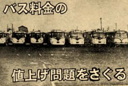
バス料金の値上げ問題をさぐる

文字どおり市民の足として、市が昭和二十五年にバス事業を始め、それから十五年目を迎えます。さいきんでは通勤、通学、レジャーにと、一日に二万三千人もの人に利用され、今後ますます利用度の高まることが予想されますので、市では根本的な都市交通対策を検討しています。今回は、市営バスの当面する問題点と対策を明らかにしてみます。