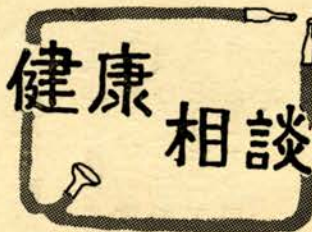
旭町と西町で乳児相談