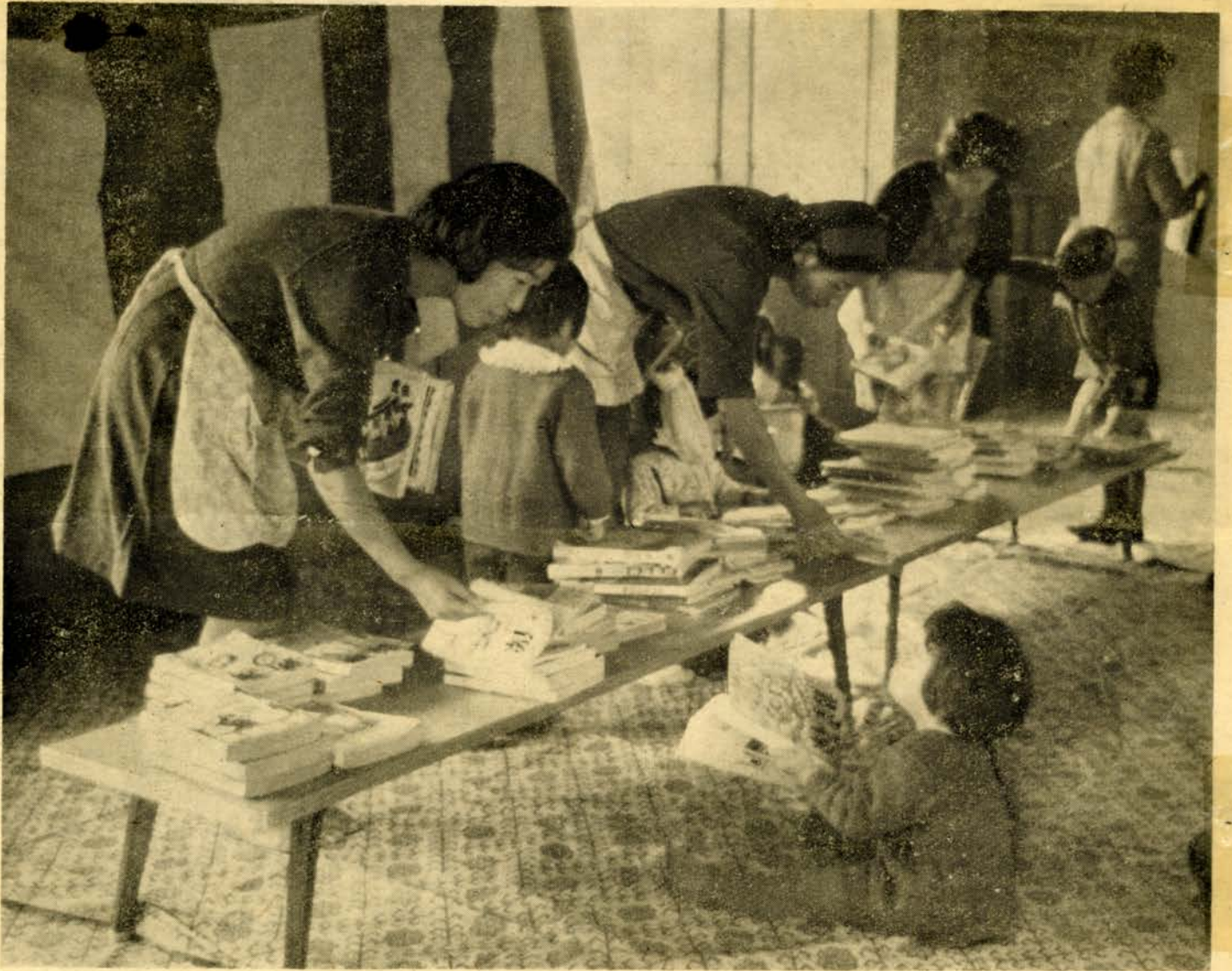
おりこうさんネ 住吉会館で

住吉会館の家庭文庫はなごやかな集まりでした。図書館では毎月巡回文庫を9か所で1回づつ、家庭文庫は2か所で3回づつ開いています。図書館の年間利用者は約8万2千人、そのうち館外利用者は約7万9千人で、96%をしめています。