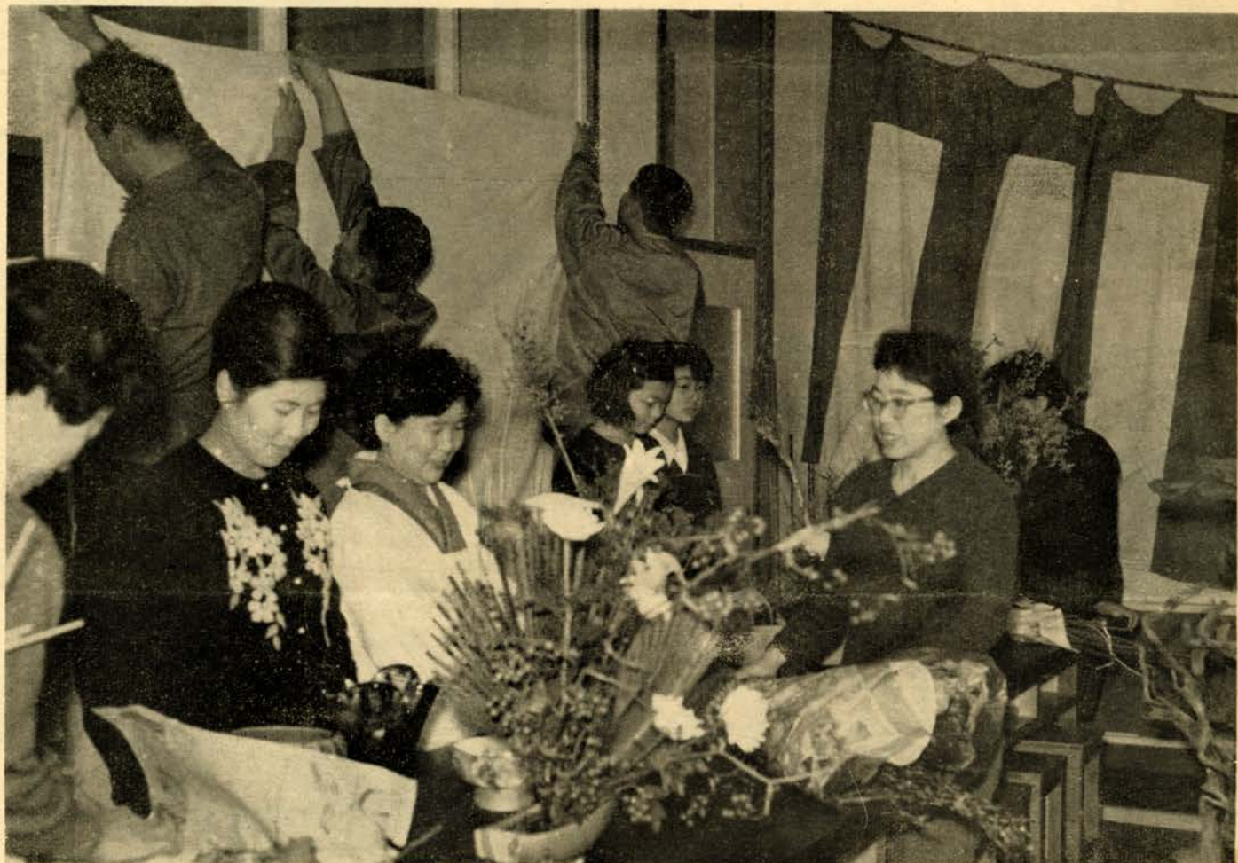
展示会の準備 錦岡町内会のみなさん