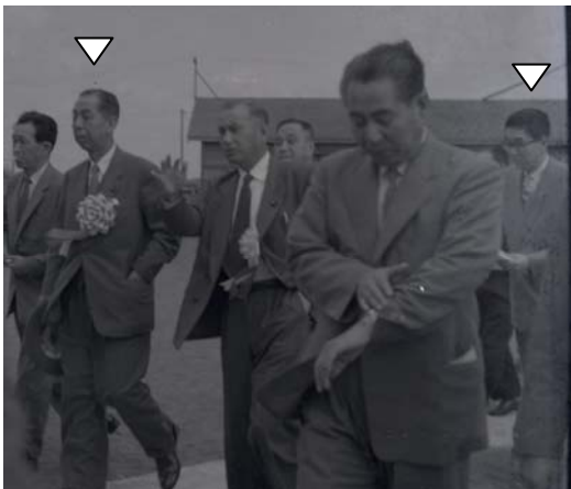
昭和32年9月岸首相（左）と安倍秘書官（右）