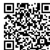
携帯電話アクセス用 QRコード