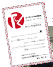
こちらが修了証書